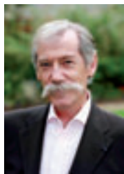
Maire de Montgeron Vice-président du Conseil général de l'Essonne

Bonne saison à chacune et à chacun d'entre vous,