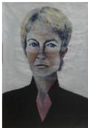
4 peintures acrylique sur papier kraft 70X100 cm

A grands coups de pinceaux je confronte nos pensées, nos âmes, et la photo devient peinture. Tout en soulignant le caractère unique et souvent grave de ces femmes, je veux mettre en lumière l'universalité de l'être. Qu'elles soient jeunes ou vieilles, seules ou non, elles nous sont familières, nous les connaissons".