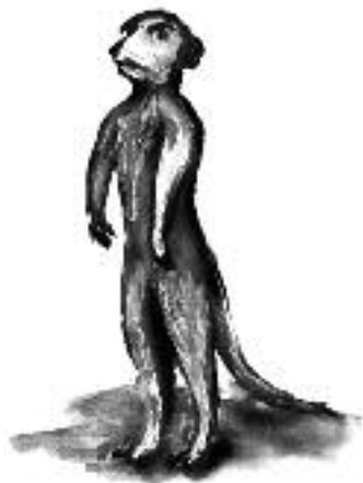
Le suricate qui n'aimait pas trop qu'on le regarde