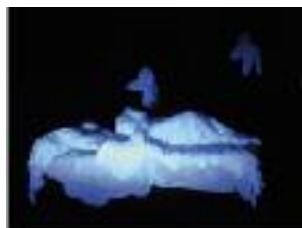
"Insomnie" juin 2014 - Gisant : 2mx1mx1m "Pleurants" : 50cmx50cmx1m