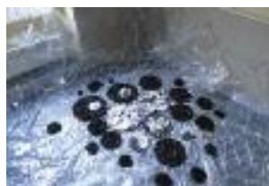
"Surgir", décembre 2015 Installation sur sol - 3mx3mx2m

L'installation "Surgir quelque part" est composée par plusieurs disques noirs qui comportent des papiers pliés figés dans la paraffine. L'apparence de fontaines, ou trous noirs rassemblés, je ne le sais. Mais quelques choses qui sont en train de surgir, là-bas, là-dedans, quelque part, sans interruption.