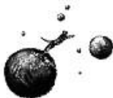
Le chat cosmique qui passait d'une planète à l'autre

L'image renvoie vers une phrase clé qui laisser place à la méditation.