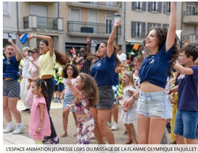
L'ESPACE ANIMATION JEUNESSE LORS DU PASSAGE DE LA FLAMME OLYMPIQUE EN JUILLET