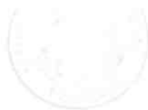
Sylvie CARILLON Maire de Montgeron Conseillère régionale d'Ile-de-France